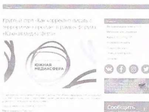
Рисунок 9 – Информация о предстоящем мероприятии

Данный пункт можно проиллюстрировать мероприятием – Круглый стол «Как корректно писать о терроризме», который прошел в рамках форума «Южная медиасфера» (см рисунок 9).