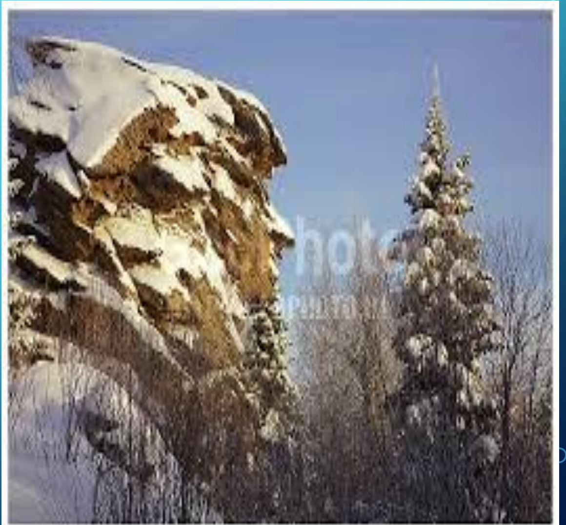
«Битумный» вал region. Бурятия Байгал-Товар 103 200700, Б.